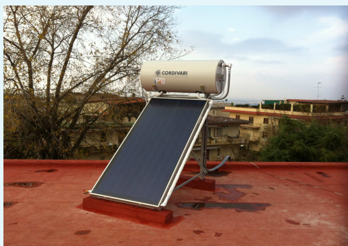
Sistema con n° 1 pannello